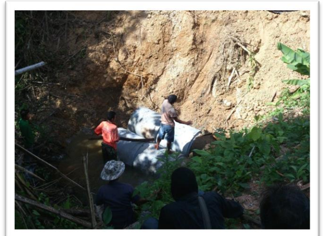
กำลังดำเนินการวางท่อเพื่อเสริมฝิวจราจร