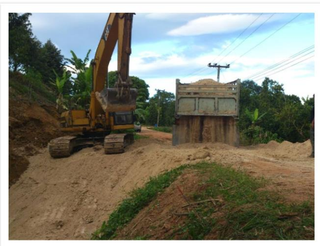
ดำเนินการถมดินขยายฝิวจราจร