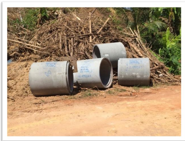
ภาพท่อระบายน้ำขนาด \varnothing 0.80 ม. จำนวน 4 ท่อน

วัตถุประสงค์ : เพื่อทำการวางท่อระบายน้ำคอนกรีตเสริมเหล็กขนาด \varnothing 0.80 เมตร จำนวน 4 ท่อนและถม ดิน จำนวน 150 ลูกบาศก์เมตร เพื่อบรรเทาความเดือนร้อนประชาชนที่ใช้เส้นทางในการ สัญจรและเตรียมการรองรับการก่อสร้างถนนคอนกรีตเสริมไม้ไผ่ถนนสายว่านเห็ดอง- ปอน้ำเงิน (ตอนที่ 2) หมู่ที่ 3,5 ตำบลชากไทย อำเภอเขาคิชฌกูฏ จังหวัดจันทบุรี