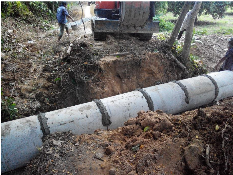
ระหว่างดำเนินการ