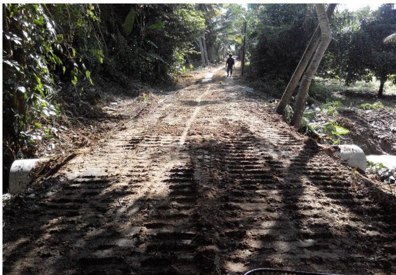
ระหว่างดำเนินการ